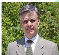
Lionel BEFFRE Préfet de l'Isère

"La première vocation de l'Etat est de protéger le pays contre les crises. Lors du premier choc de la crise sanitaire, les services publics ont organisé la protection de la population par des mesures sans précédent. Aujourd'hui, nous organisons la relance en mobilisant toutes les ressources économiques du pays. Entreprises, associations, collectivités, Etat : le plan France relance fournit des réponses et des leviers pour n'oublier personne.